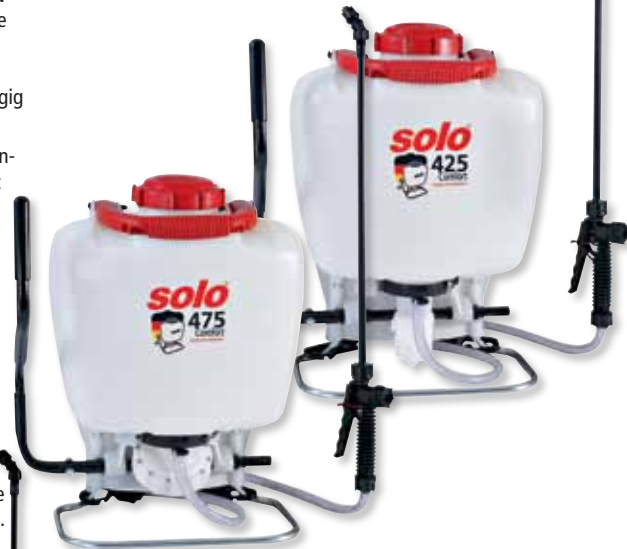
Vielfach verstellbarer Pumphebel für ergonomische Bedienung

Die Rückenspritzen SOLO 425 Comfort, 475 Comfort und 435 Comfort sind sehr robuste Rückenspritzen für intensiveren Einsatz und für anspruchsvolle Anwender. Sie sind aufgrund ihrer Ausstattungsmerkmale Bestandteil der SOLO Comfort Line.